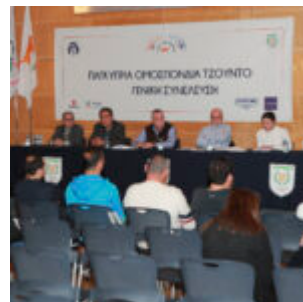
Γενική Συνέλευση της Ομοσπονδίας Τζούντο 2024