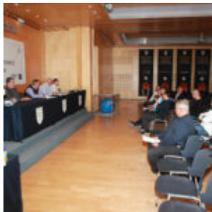
Γενική Συνέλευση της Ομοσπονδίας Τζούντο 2024